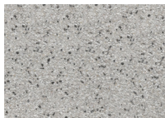
tytan szary jasny