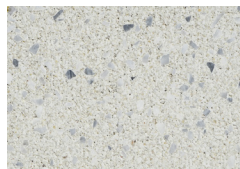
granodioryt jasny [Y68]