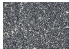
granodioryt stalowy [Y67]